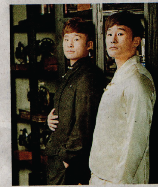
▲除了女士服飾，Jos亦為男士提供服務