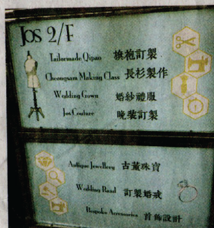
▲位於炮台山英皇道的樓上舖Jos，是綜合高級訂製旗袍與各式珠寶的專門店