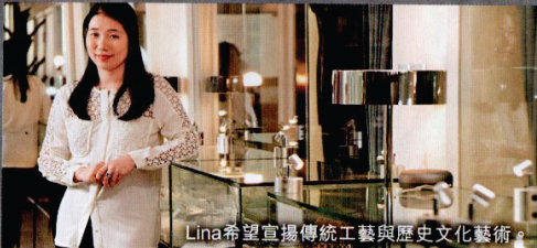
Lina希望宣揚傳統工藝與歷史文化藝術。